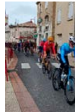
La course à travers le village