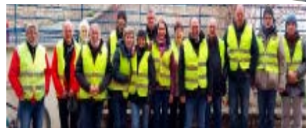
Les bénévoles et l'équipe des "costauds"

Un très beau panel avec pour le classement final, la victoire du Suisse Hirschi.