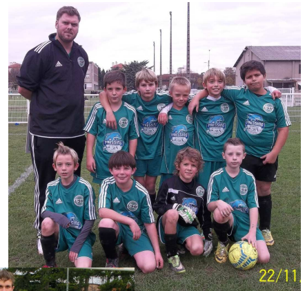
En photo : les U11 A, B et C

Les cartons sont en vente auprès des joueuses, joueurs, dirigeantes et dirigeants de l'USM. Ils seront également sur place, au prix de 2.50 euros