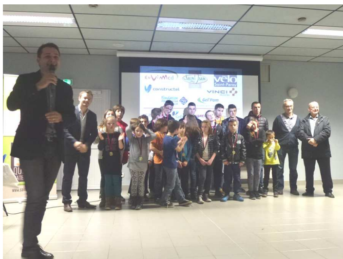
Les jeunes récompensés

Cette assemblée s'est clôturée avec le traditionnel verre de l'amitié et tous ont salué la dynamique du club de l'UCMV .